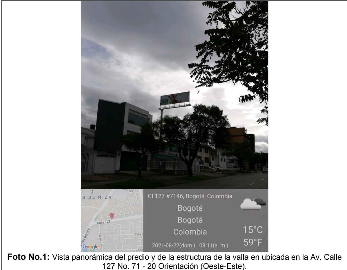
Foto No.1: Vista panorámica del predio y de la estructura de la valla en ubicada en la Av. Calle 127 No. 71 - 20 Orientación (Oeste-Este).